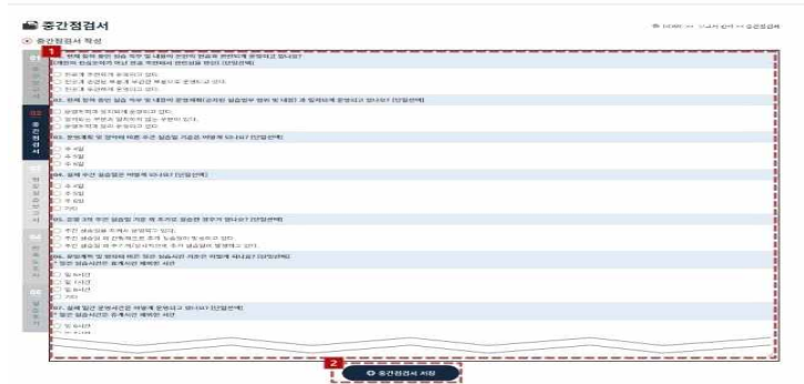
중간점검서 작성(보고서 관리)